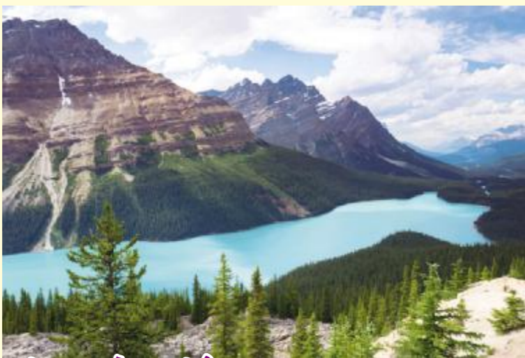
银杏苑 加拿大班英

学者,简直是寥若晨星。如班昭、蔡文姬、谢道韞、薛涛、鱼玄机、朱淑真……她们留下的诗文大都不多且不确定,她们的名字或附于家族父兄,或出现在野史轶事中。作为女子,她们的生命轨迹似乎早已划定,她们的成就只是男性书写的文学史中小小的特别点缀。“才女”的形象遵循着男性的想象而塑造,以至于我们忽略了那海面之下的冰山,那是更为庞大的知识女性群体,她们有着历史文献记载之外的多姿多彩的生活和更为丰富的情感世界。感谢李清照!她为我们展示了女性多重的境界,不仅有“和羞走,倚门回首,却把青梅嗅”(出自《点绛唇·蹴罢秋千》)或“帘卷西风,人比黄花瘦”(出自《醉花阴·薄雾浓云愁永昼》)的女儿情态,“寻寻觅觅,冷冷清清”(出自《声声慢·寻寻觅觅》)与“才下眉头,却上心头”(出自