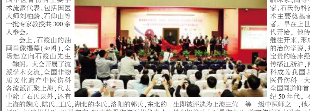
石筱山先生诞辰110周年大会在龙华医院举行。

本报讯 10月25-26日，“纪念著名中医学家、临床家、教育家石筱山先生诞辰110周年大会——暨2014年中医骨伤流派与非物质文化遗产传承高层论坛”在龙华医院举行。本次大会由我校、中华中医药学会主办，龙华医院、黄浦区中心医院、我校脊柱病研究所、石筱山骨伤科学术研究中心承办。来自全国各地的石筱山先生弟子门人及全国中医骨伤科主要学术流派代表，包括国医大师刘柏龄、石仰山等一批专家教授共300余人参会。