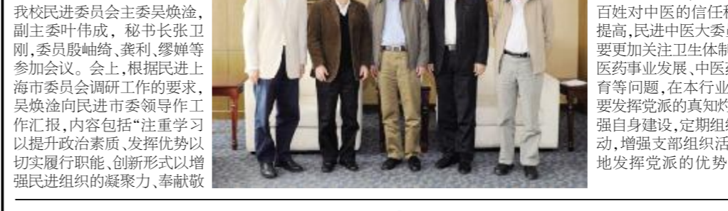
民进中央副主席一行来校调研合影。

本报讯 10月15日下午，民进中央副主席、上海市人大常委会副主任、民进上海市委主委蔡达峰，民进上海市委副主委许政涛，秘书长黄山明，组织部部长何少华等一行来我校调研。我校党委书记张智强、副书记何星海等在会前与蔡达峰一行就今后我校民进工作提出了自己的想法；蔡达峰一行就今后我校民进工作提出了自己的想法；蔡达峰一行就今后我校民进工作提出了自己的想法。