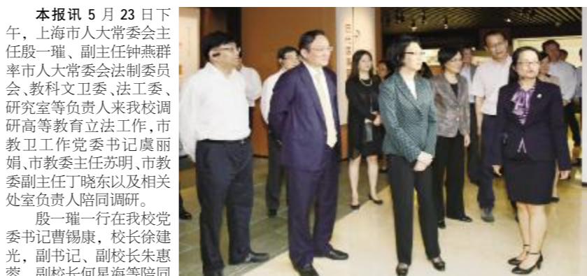
市人大常委会主任殷一璀一行来我校调研高等教育立法工作合影

殷一璀肯定了学校目前取得的成绩和为上海科创中心建设所作的贡献。她指出,目前上海中医药大学发展迅速,在推进中医药事业发展的同时,也加强了对外交流与合作,希望学校在高水平地方大学和世界一流中医药大学建设的道路上持续取得新进展。殷一璀要求我校定位中医药独特优势,立足张江地区经济发展,加强学生德育教育,努力处理好传承与创新的关系,争取中医药国际话语权,坚韧不拔地推进学校发展。