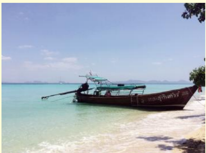
银杏苑 碧海一舟

亲身穿着衣来体验,职业生诞中明人生如同黑夜中海上航行的船只,在黑暗中对前路充满迷茫。在之前的导师采